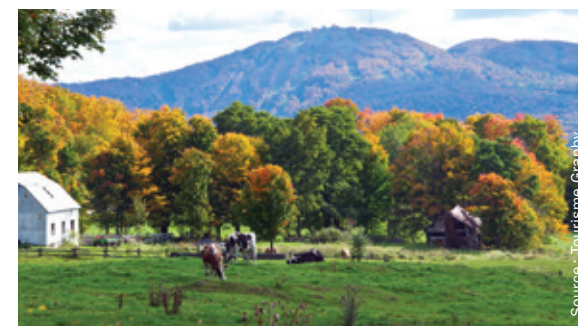
Figure 2.6.e LA MULTIFONCTIONNalité DU TERRITOIRE