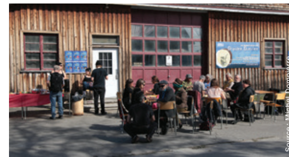
Figure 2.6.b PRÉSERVER L'INTÉGRITÉ DE L'ANCIENNE FORGE EN CHANGEANT SA VOCATION