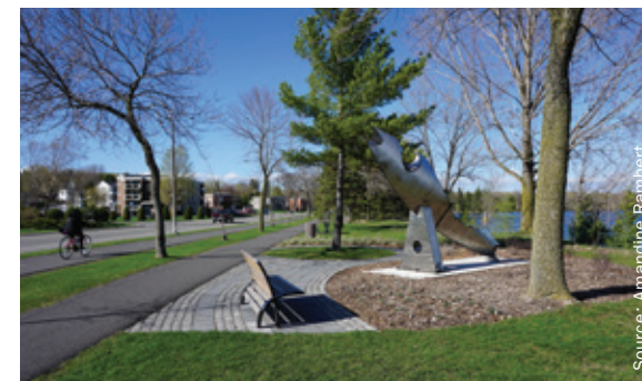
Figure 2.6.d DES ESPACES PUBLICS JOUANT PLUSIEURS RÔLES À GRANBY

La démarche d'aménagement culturel du territoire est finalement une manière de miser sur les forces du territoire pour le rendre unique et attractif. Elle s'avère relativement facile à mettre en place et capable de générer des retombées considérables.