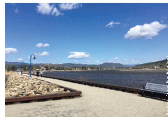
Figure 2.6.a BAIE-SAINT-PAUL

Pour la plupart des villages, la culture locale s'est notamment traduite par la formation d'un noyau villageois concentrant l'église, l'école, le magasin général, la caisse populaire et des habitations. La culture locale prend aussi parfois une forme immatérielle (p. ex. la transformation d'un aliment ou la pratique du canot à glace) dont l'aménagement peut tirer parti, avec, par exemple, le nom des rues ou le réaménagement des espaces publics.