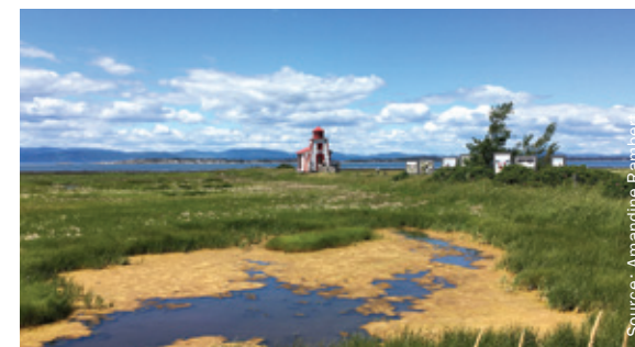
Figure 2.6.c DES FENÊTRES SUR LE PAYSAGE À KAMOURASKA

À Trois-Pistoles, la forge à Bérubé a été transformée en salle de spectacle et demeure ainsi un lieu de rassemblement. Elle accueille dans un lieu de caractère le Rendez-Vous des Grandes Gueules, un festival des contes et récits. Sa localisation dans une centralité ancienne, sa valeur historique, symbolique et identitaire, et la contribution de ses activités à la vitalité et au foisonnement culturel de Trois-Pistoles rendent cette conversion particulièrement intéressante.