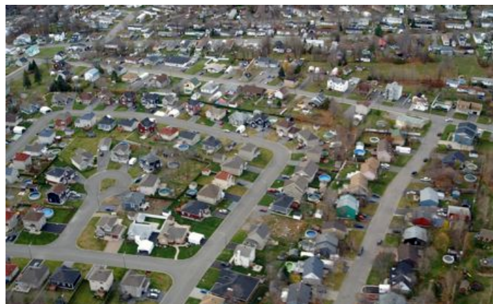
APEL Lac Saint-Charles