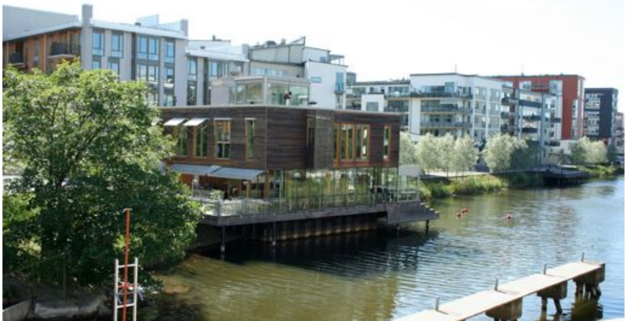
Hammarby, Suède