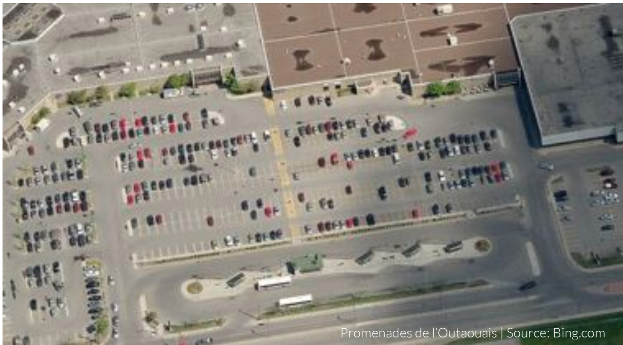
Promenades de l'Outaouais

Avec ce modèle, les municipalités échangent donc des responsabilités à long terme d'entretien, de réparation et de remplacement d'infrastructures contre des entrées à court terme de liquidités sous forme de taxe foncière, de permis de construction, de taxe de mutation et de subsides gouvernementaux liés au financement des infrastructures. Dans un système équilibré, ces revenus devraient permettre de couvrir à la fois les obligations courantes, comme l'entretien adéquat des infrastructures en place et le maintien des services déjà disponibles à la population, et les investissements liés à leur expansion, lorsque la croissance le justifie. Cet équilibre n'est bien souvent pas assuré.