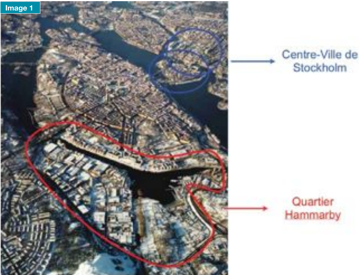
Localisation du quartier Hammarby, à proximité du centre-ville.