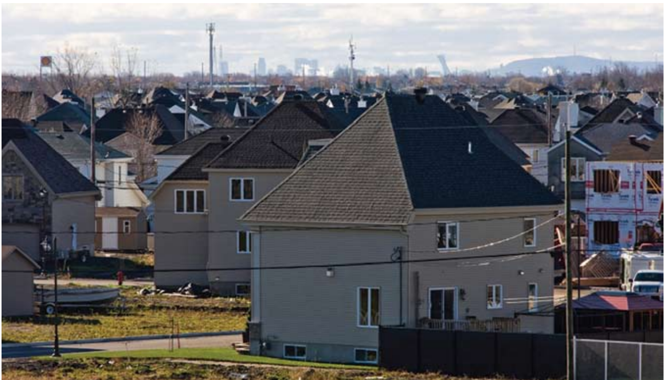
Vue de Montréal depuis un quartier de banlieue à Repentigny.

Face à l'opération de révision de la localisation de ses succursales entreprise par la SAQ, Vivre en Ville a participé au mouvement de contestation initié par des élus locaux aux prises avec la fermeture de succursales situées au cœur de noyaux urbains. Pour Vivre en Ville, la délocalisation des succursales SAQ contribue à la dévitalisation des cœurs de villes et à l'étalement urbain. Vivre en Ville a notamment cosigné avec les maires de trois villes québécoises une lettre ouverte sur la localisation des commerces de la société d'État.